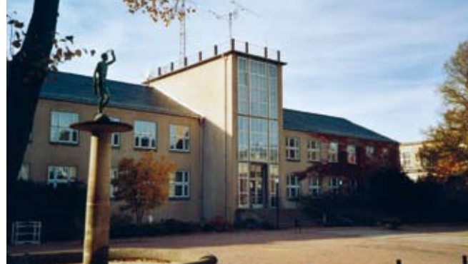
Istituto per la corrente a bassa tensione "Barkhausen-Bau", Karl-Wilhelm Ochs, 1950-53

propria la città, fortemente distrutta e nel frattempo diventata socialista. Questa forza, venuta formandosi nel corso di una lunga serie di conflitti con le autorità, si disvela in particolare con la svolta politica dopo il 1989, quando importantissimi progetti nell'ambito del risanamento e della ricostruzione della città, soprattutto nel centro storico, sono segnati dall'icona della vecchia Dresda. Un molteplice valore simbolico lo ha in questo senso la ricostruzione della "Frauenkirche" – ultimata alla fine del 2005 – che, pur essendo in definitiva un edificio nuovo, riconsegna alla città il suo richiamo centrale.