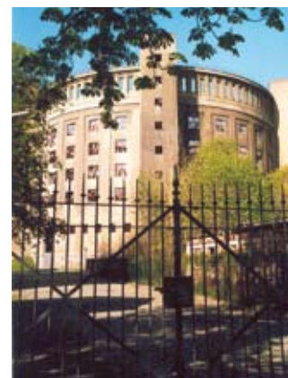
Großer Gasometer, Officina del gas, Dresda – Reick, Hans Erlwein, 1907/08

del settore dell'approvvigionamento. Erlwein diede inoltre vita a un nuovo linguaggio delle forme in cui i tratti regionali non vengono imitati, bensì modificati e trasposti nella nuova epoca: un fenomeno che anticipa l'architettura moderna dei decenni successivi. Uno dei primi esempi dell'architettura moderna del dopoguerra è la sede amministrativa del VEB Strömungsmaschinen del 1957/58 su progetto di Axel Magdeburg.