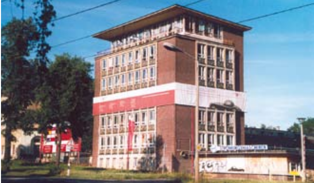
Sede amministrativa dello Strömungsmaschinenwerk, Axel Magdeburg, 1957/58