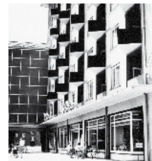
Complesso abitativo nella Borsbergstrasse

complessi di prefabbricati costruiti alla periferia della città, quanto per alcune isolate unità architettoniche e urbanistiche di rimarchevole qualità: pur contrassegnando l'immagine della città, restano architetture fino ad oggi quasi del tutto senza nome e questo nonostante i loro artefici appartengano al nostro tempo. La scoperta di queste testimonianze (vedi il Kulturpalast o il Rundkino) porta a nomi quali Leopold Wiel, Wolfgang Hänsch o Gerhard Landgraf, noti ad architetti e urbanisti, probabilmente sconosciuti invece ai più.