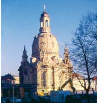
La nuova Chiesa di Nostra Signora (Frauenkirche)

La mostra non propone una panoramica completa, offre piuttosto la possibilità di un avvicinamento progressivo capace di far acquisire contorni più nitidi a tendenze, sviluppi e nessi dell'azione degli architetti nella storia di Dresda del XX secolo. Le sezioni tematiche seguono approcci metodologici diversi che rispecchiano sia la complessità della storia dell'architettura, sia i differenti modi di rapportarsi ad essa. Ci auguriamo che possano anche essere un invito e uno stimolo a ulteriori ricerche sull'argomento.