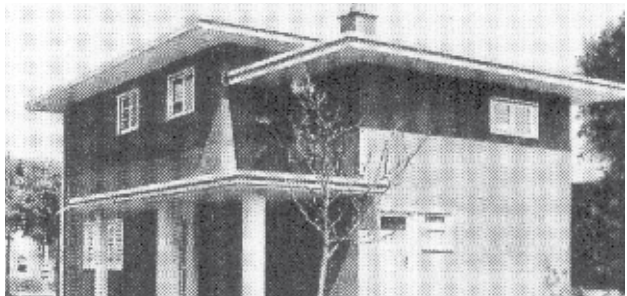
Plattenhaus 1018, Auf dem Sand 26, Bruno Paul, 1925

male l'idea dei complessi residenziali sviluppata prima del 1914.