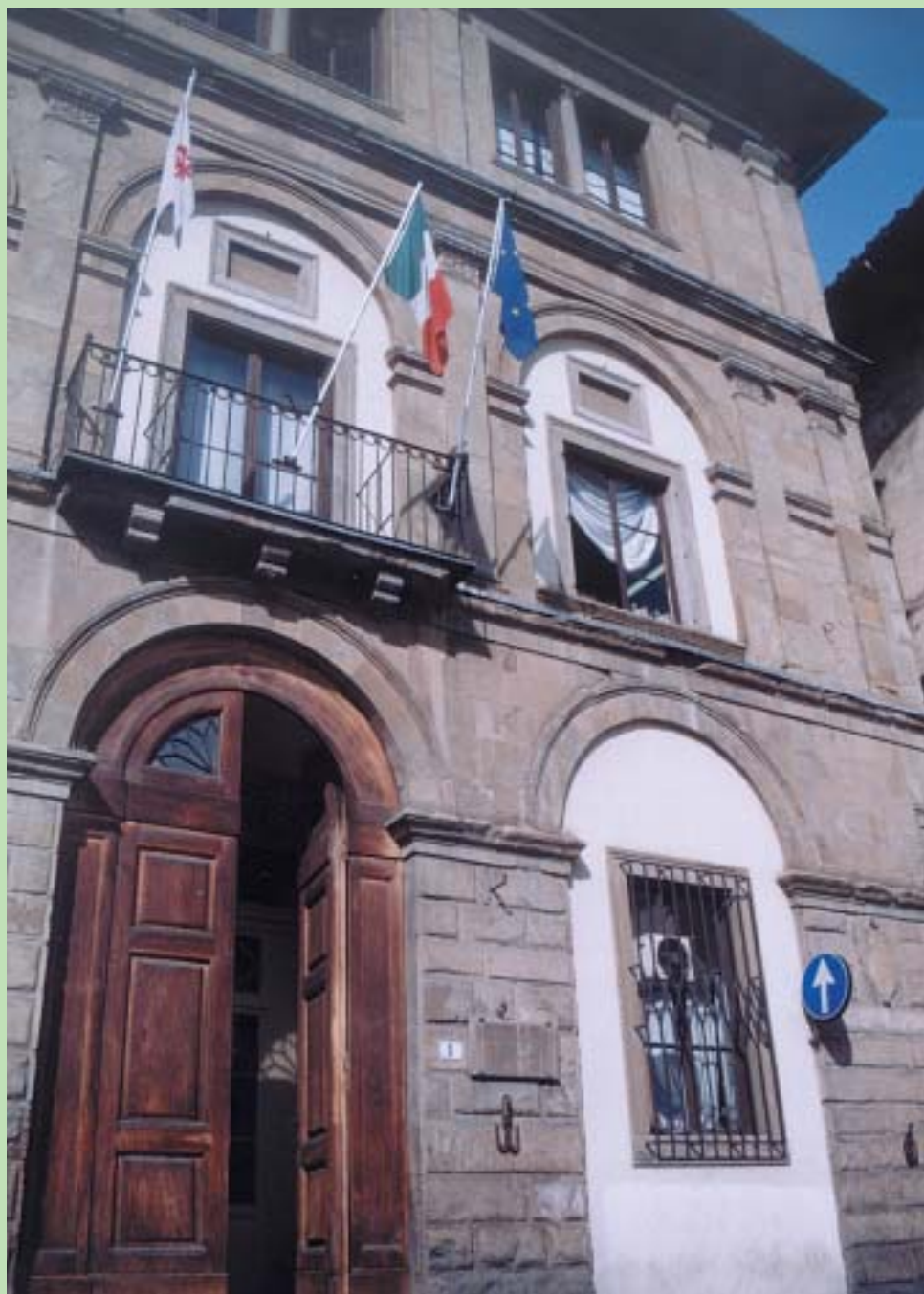
Palazzo Cocchi-Donati-Serristori, sede del Centro Civico del Quartiere 1